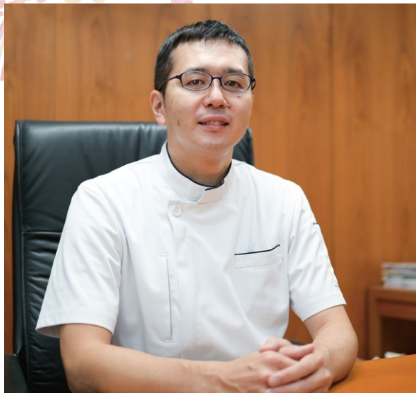
医療法人 仁成会 理事長 社会福祉法人 仁成福祉協会 理事長